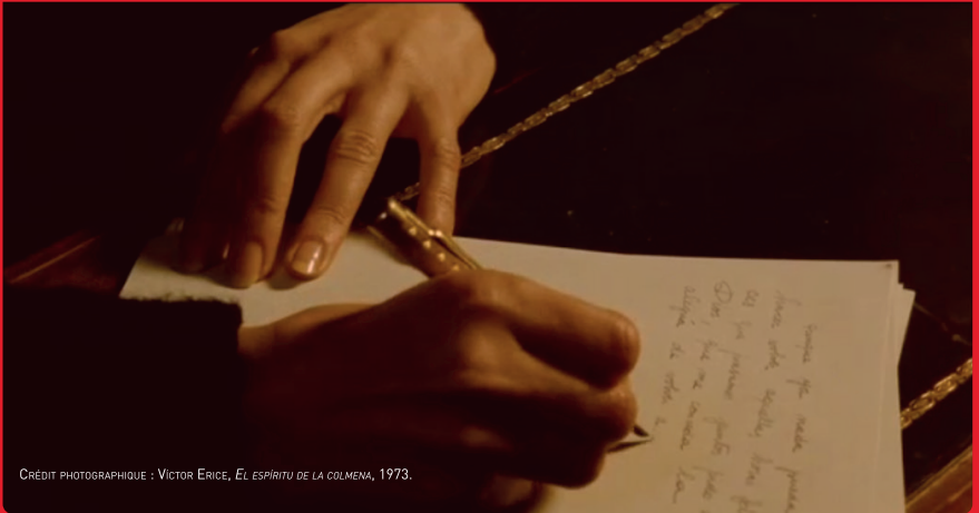
CRÉDIT PHOTOGRAPHIQUE : VICTOR ERICE, EL ESPÍRITU DE LA COLMENA , 1973.